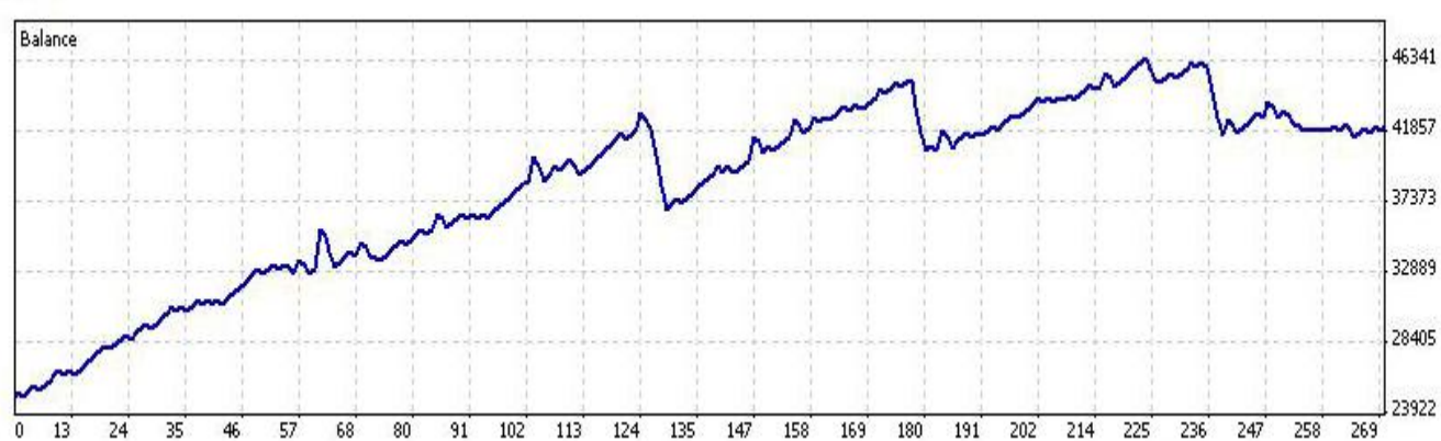
C 客户实盘资金曲线图：