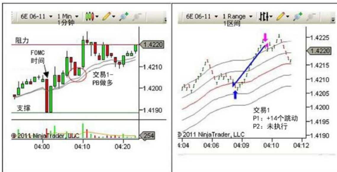
图 3.2——交易示例 1 1