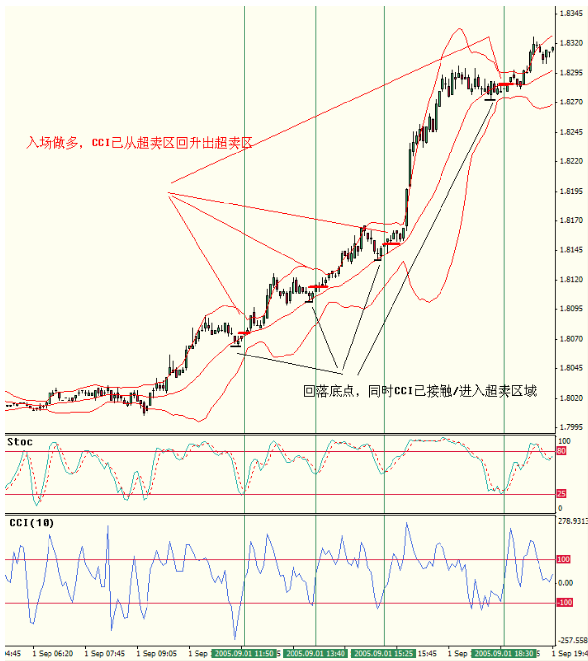
图 6 GBP 01/09/05 日 5 分钟图 BB 20,2 MA 20 CCI 10 Stochastic 14,3,3

这里讲一下，我个人认为 CCI 简直就是为了追涨杀跌而创造的。。但是追入时一定要注意：